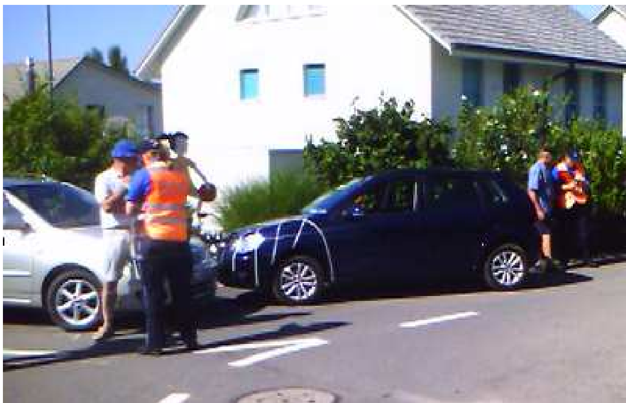
Illustrazione 1: foto dell'esame pratico Incidente della circolazione 12-07 a Aarau, ISP